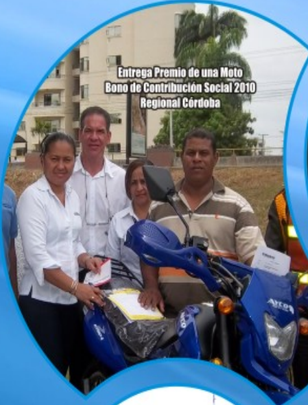
Entrega Premio de una Moto Bono de Contribución Social 2010 Regional Córdoba