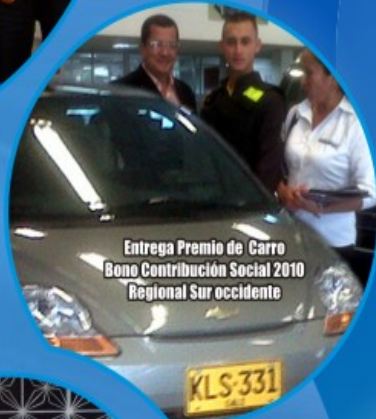
Entrega Premio de Carro Bono Contribución Social 2010 Regional Sur occidente