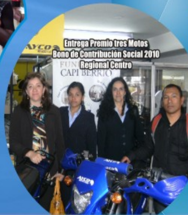
Entrega Premio tres Motos Bono de Contribución Social 2010 Regional Centro FUN CAPI BERRIO