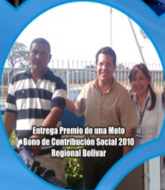
Entrega Premio de una Moto Bono de Contribución Social 2010 Regional Bolívar